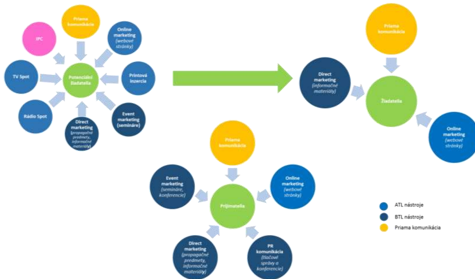
Obrázok 1: Komunikačné nástroje navrhnuté na rok 2018 pre cieľovú skupinu č. 1 Potenciálni žiadatelia o NFP, žiadatelia o NFP a prijímatelia