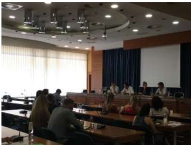
Zasadnutie pracovnej skupiny pre nezrovnalosti dňa 22. júna 2017

V roku 2017 sa členovia Pracovnej skupiny k článku 325 ZFEÚ podieľali na vypracovaní dokumentu: „Odpovede k dotazníku OLAF, všeobecná časť – Správa o ochrane finančných záujmov (PIF) 2016“. V nasledujúcom období sa bude v rámci pracovnej skupiny vypracovávať aj sledovanie plnenia odporúčaní vyplývajúcich zo Správy o OFZ EÚ za rok 2016 a pracovná skupina bude prehodnocovať a nastavovať novú metodiku Analýzy relevantných všeobecne záväzných právnych predpisov a systémov riadenia kontroly so zreteľom na ich odolnosť voči podvodom a korupcii, dodržiavanie zásady riadneho finančného hospodárenia.