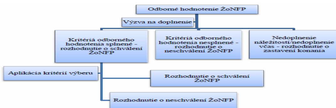
Model odborného hodnotenia ŽoNFP

Odborné hodnotenie vykonávajú odborní hodnotitelia, ktorým sú náhodným výberom pridelené ŽoNFP, ktoré splnili podmienky poskytnutia príspevku overované v rámci administratívneho overovania. V rámci odborného hodnotenia ŽoNFP SO zabezpečí posúdenie ŽoNFP dvoma odbornými hodnotiteľmi, ktorí vyhodnotia v totožnom rozsahu hodnotiace kritériá, v rámci ktorých overia aj podmienku oprávnenosti výdavkov realizácie projektu.