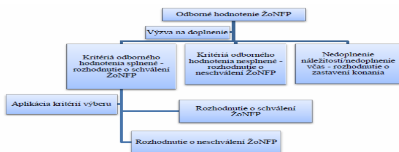
Model odborného hodnotenia ŽoNFP

Odborné hodnotenie vykonávajú odborní hodnotitelia, ktorým sú náhodným výberom pridelené ŽoNFP, ktoré splnili PPP overované v rámci administratívneho overovania. V rámci odborného hodnotenia ŽoNFP SO zabezpečí posúdenie ŽoNFP dvoma odbornými hodnotiteľmi, ktorí vyhodnotia v totožnom rozsahu hodnotiace kritériá, v rámci ktorých overia aj podmienku oprávnenosti výdavkov realizácie projektu.