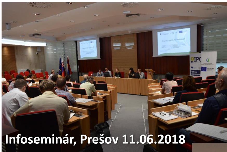
Infoseminár, Prešov 11.06.2018