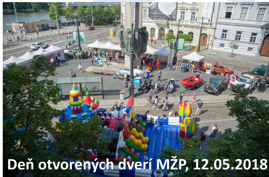
Deň otvorených dverí MŽP, 12.05.2018