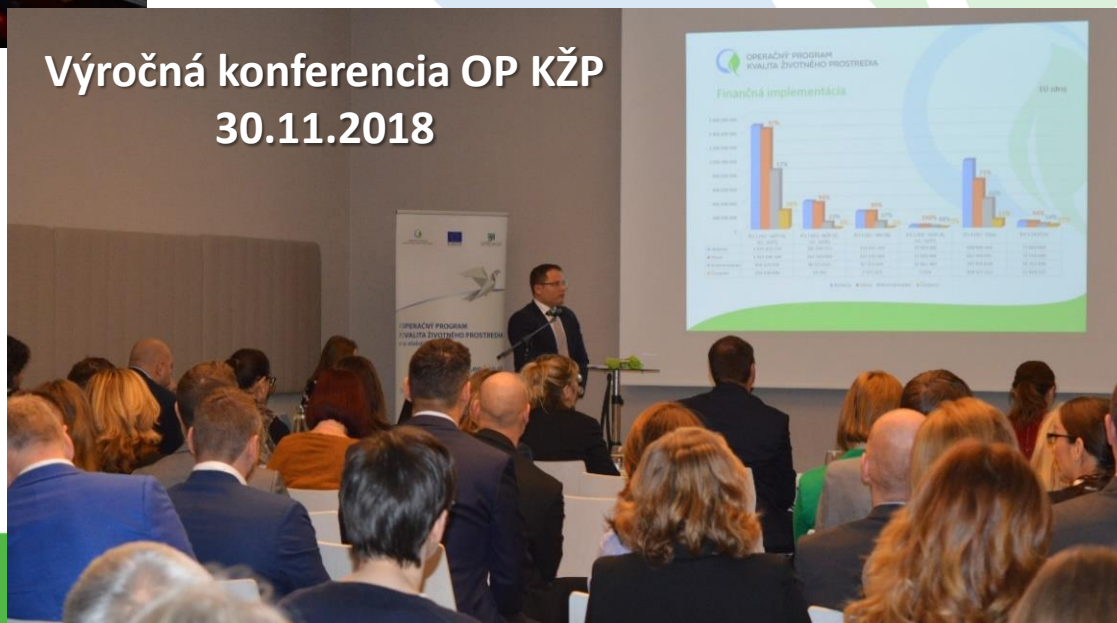
Výročná konferencia OP KŽP 30.11.2018