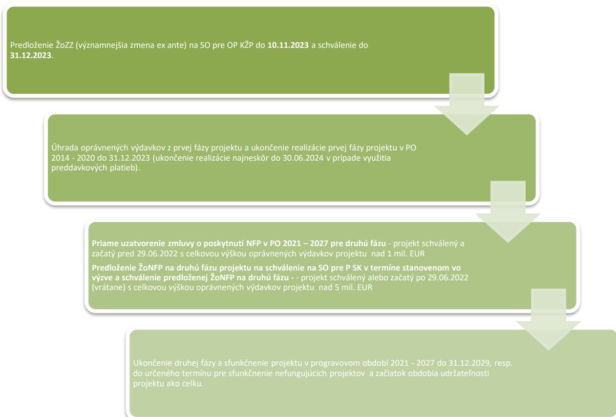
Schéma 2 Proces fázovania projektov, ktoré neboli v ŽoNFP rozdelené na fázy